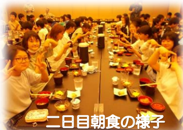
二日目朝食の様子