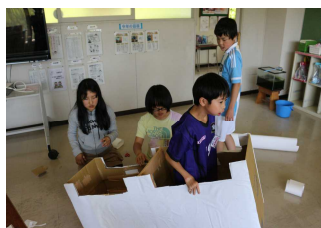
馬作り！どんな馬が完成するのか！？こうご期待！！(5.23)