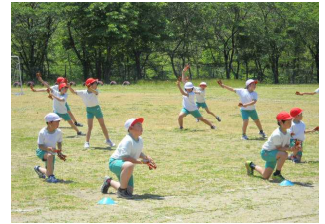
大倉よさこいソーラン

初夏の風が心地よい季節となりました。学習や運動にも適した時期になり、子どもたちは朝マラソンや各活動に進んで取り組んでいます。特に、今週土曜日に迫った運動会に向けての練習に一段と熱がこもってきました。「よさこいソーラン」「定義太鼓」の練習では、高学年が中心になりながら下級生に熱心に教える姿が見られ、迫力ある発表が期待されます。「たてわり対抗リレー」では、バトンパスやタイミングを繰り返して練習しています。そして、注目されるのが今年度が初となる競技「大倉ダービー2015」です。馬は子どもたちの手作りで、馬のデザインや名前まで、子どもたちが考えました。また、速く走るためのポイントなどについても進んで作戦を練り合う様子も見られます。子どもたちからは、「大倉小学校の新しい伝統にするぞ！」という言葉も聞かれ、新種目への意気込みが十分に伝わってきます。