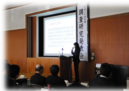
平成 24 年度調査研究発表会より