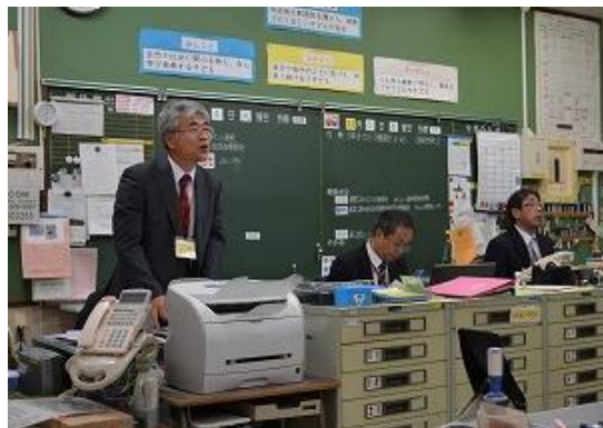
職員会議ミニ研修「コンプライアンス」