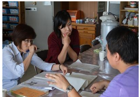
プロセスシートを活用した「授業検討会」