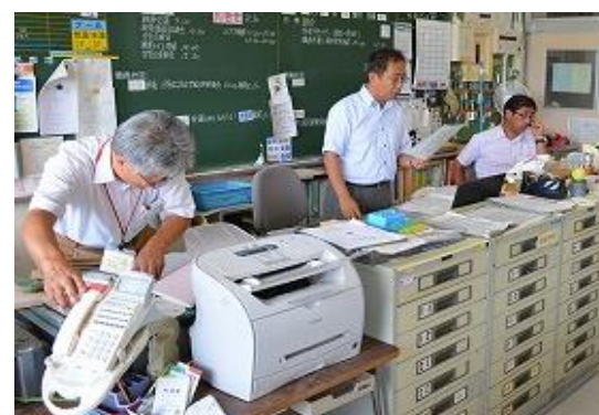
トップダウン研修「学校の当たり前」