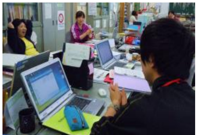
いつでもどこでも学年部 OJT