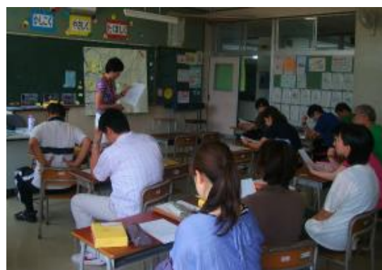
15分ミニ研修「付箋紙による見える化」