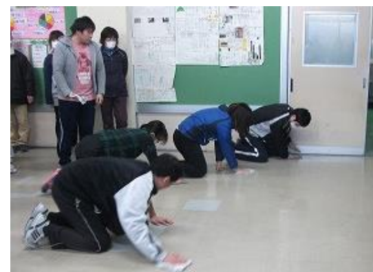
ボトムアップミニ研修「全校一斉清掃の仕方」