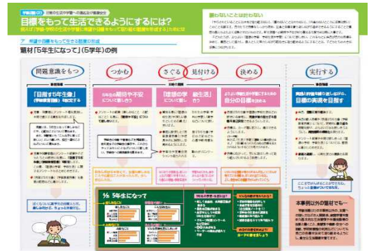
【図2 学級活動(2)の指導過程】