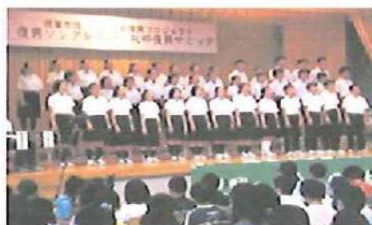
「仲間とともに」を披露していただいた第一中学校のみなさん