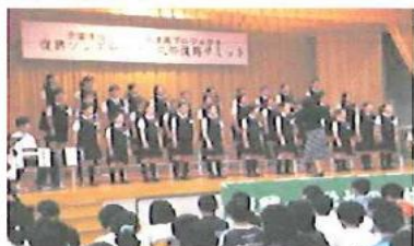
「希望の道」を披露していただいた金剛沢小学校のみなさん