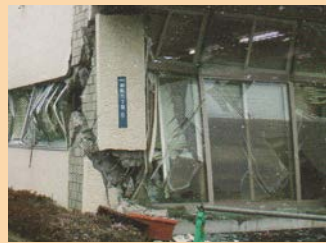
こわれたビルのまど

わたしたちの家や学校のまわりで は、どんなところにちゅういしたら よいかをしらべて、あんぜんにひな んでできるようにしましょう。