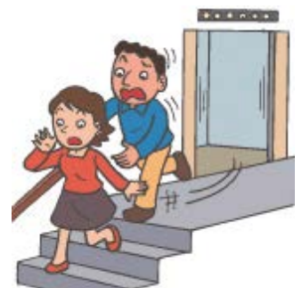
エレベーターでは…

まちをある 歩いているときは… うえ 上からものがおちてきたり、たおれたりしないだろうか。