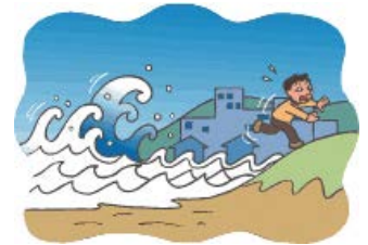
うみ ちか 海の近くにいると…