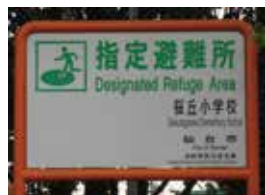
ひなんじょのかんばん

交番，しょうぼうしょ，AED，こうしゅう電話，高いたてもの，こうしゅうトイレ など