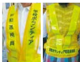
地いきのボランティアさん