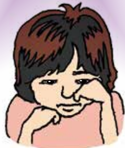
かなしくて なに 何もしたくない