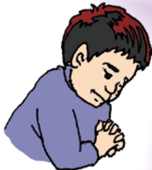
おも だ 思い出してつらい