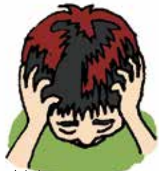
あたま 頭 やおなかが いたくなる