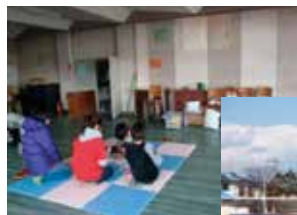
小さな子どもと本を読む生徒

学校の避難所では、お年寄りに部活動のウィンドブレーカーを貸したり、浸水のため裸足になってしまった住人に靴を貸したりした生徒もいました。仙台港の方角からは火柱が上がっていましたが、幼い子が不安にならないようにする生徒の姿もありました。