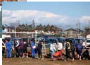
校庭の土砂を運ぶ生徒

一夜明けて、水は引いていたものの、校庭はたくさんの土砂と動かない車で埋め尽くされていました。卒業式の準備をしていた体育館は基礎が破壊され、使用できなくなりました。今まで見慣れていたはずの風景が一変してしまったのです。生徒たちは校庭の土砂をかき出したり、支援物資の運搬をしたりするなど自分たちができることを探し、精一杯手伝えました。避難してきた幼い子どもたちに絵本の読み聞かせをする姿も見られました。生徒たちは「高中魂」を合い言葉に、みんなで一步ずつ前進していきました。