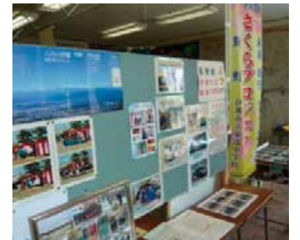
震災や復興を伝える防災展示室

高砂中では震災を風化させないために、「私たちに何ができるのか」をテーマに、地域への貢献活動や他県中学校との交流活動など様々な取り組みをしています。地域合同の避難訓練では、幼児やお年寄りに手を貸す姿が見られるようになり、「守られる側から、守る側へ」と意識が確実に変わってきています。また、部活動を通して小学生と関わることにより、地域での一体感も育ってきています。震災を乗り越えてきた高砂中生は、これからも地域の中で中心的な役割を果たしていくでしょう。