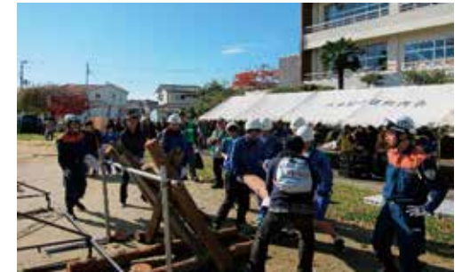
地域の方々と合同防災訓練（郡山中）