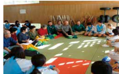
地域の方々が中学生に期待することは（南小泉中）