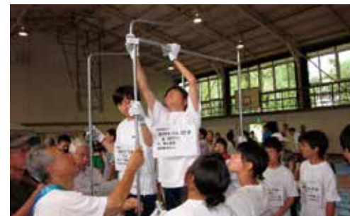
地域の方々と避難所開設訓練（北仙台中）