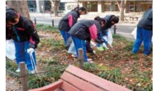
私たちの町は私たちの手で（南吉成中）