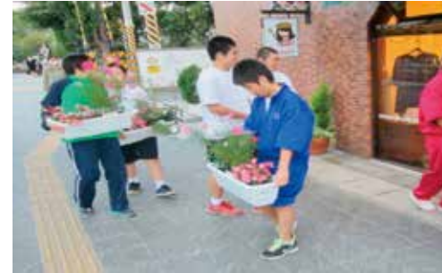
地域の方々にコスモスのおすそわけ（五城中）