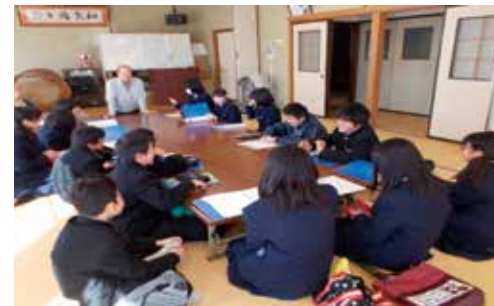
町内会長さんと地域防災についての話し合い（七郷中）