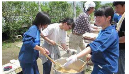
非常時に備えた炊き出し訓練（長命ヶ丘中）