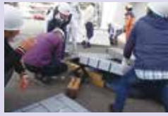
防災力を高めている地域防災リーダー（SBL）の方々

小学生や中学生は、一日のほとんどを自分たちが住んでいる地域の中で活動している。保護者は地域の外で働いていることが多く、災害時には地域にいないことが考えられる。今回の震災では、中学生が地域の大きな力となるのが分かり、今後も様々な場面での活躍が期待されている。地域の防災について知り、自分たちが取り組めることを考えてみよう。