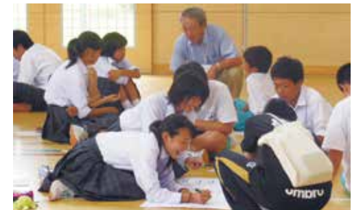
地域の方々と避難所運営を考える（中田中）