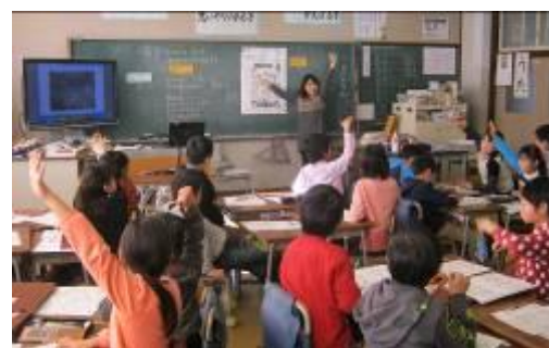
安全な避難経路について全員で話し合う

地震はいつでも起きるので大変だなと思いました。後、避難する場所を考えた方がいいんだなと思いました。一人でも逃げられるようにしておこうと思います。