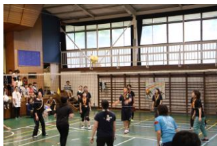
繰り広げられる熱戦