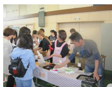
会長さんも販売のお手伝い