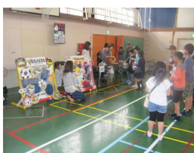
ストラックアウトに熱中