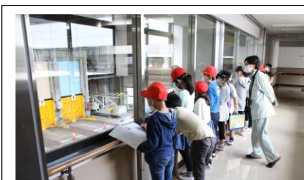
4年校外学習（清掃工場）