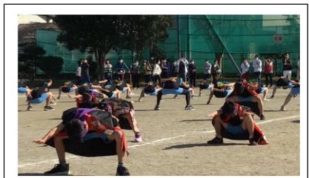
学習成果発表会（体育）