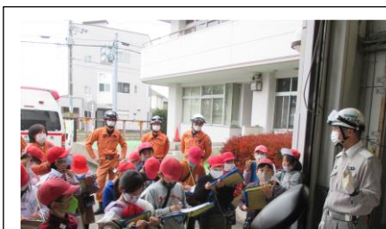
3年校外学習（消防署）