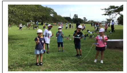
1年校外学習（三神峯公園）