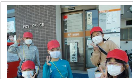
2年校外学習（町探検）