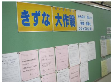
きずな大作戦掲示板