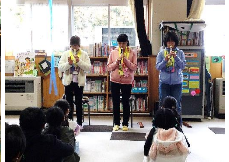
<心を込めたプレゼントの贈呈>