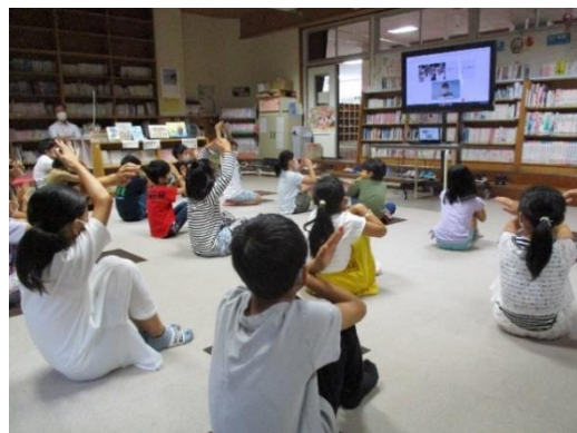
画面を通して学習(クイズにも!)