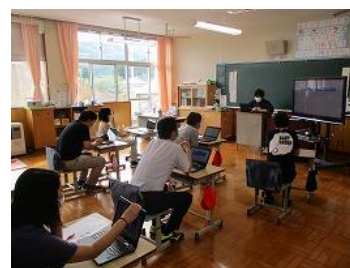
クロームブックを活用しての授業や教員の研修の様子