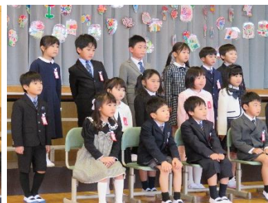
記念撮影は、ちょっと緊張気味。