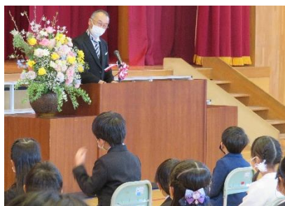
「はい!」としっかり返事ができます。

始業式または入学式で、校長先生の話をしっかり聞いた子供たち。6年生は、朝に1年生の教室で、荷物の片付けのお世話をしたり、紙芝居を読んだりしていました。子供たちは新しい仲間を大切にしながら、学習をスタートさせています。子供たちみんなが、夢を持って頑張ることができるように、学校と家庭と地域で子供たちを応援していきたいと思っておりますので、ご協力をよろしくお願いいたします。