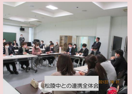
松陵中との連携全体会