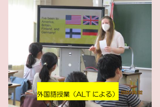
外国語授業(ALTによる)