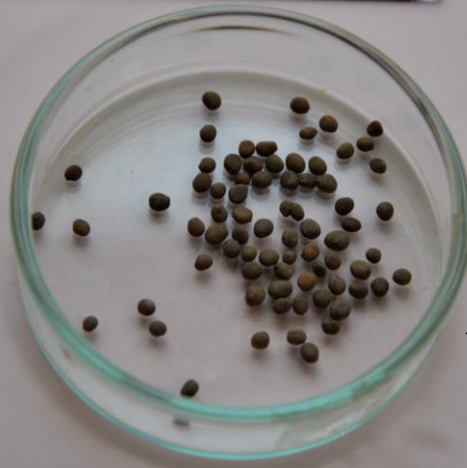
ホウセンカ のたね