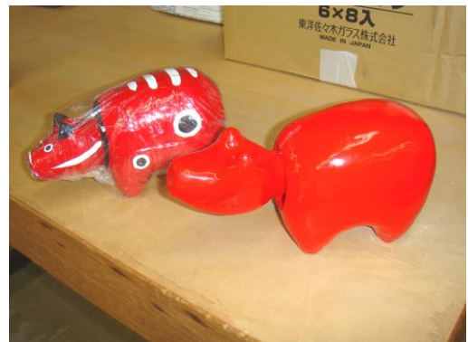
会津の伝統工芸 赤ベコ