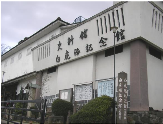
豊富な資料を誇る白虎隊記念館