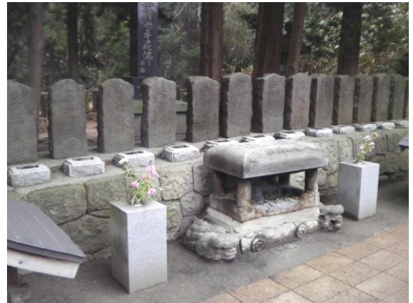
仲間と共に静かに会津を守護しています