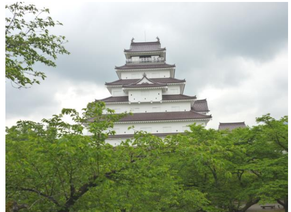
今は若葉に包まれています