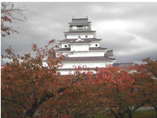
皆さんが行く秋の鶴ヶ城は、こんな佇まいです

会津のシンボルと言えば、何と言っても鶴ヶ城です。戊辰戦争時、五千人もの命を守り、大砲の砲弾を数千発打ち込まれても、決して落城しなかった名城です。会津の人々の正義と忍耐、そして希望の象徴でもあります。会津の栄光と苦難の歴史を見守ってきた鶴ヶ城。どのような歴史や特徴があるのか、興味を持ったなら調べてみましょう。