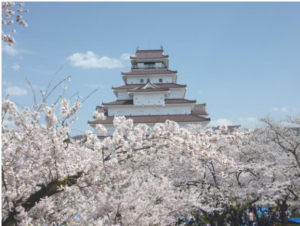
桜に浮かぶ春の鶴ヶ城

以下に、会津の写真をいくつか紹介してあります。こんな状況だからこそ、時間をかけて学び、最高の修学旅行にしていきたいと思います。