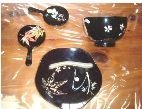
漆器に絵付けした 蒔絵(まきえ)