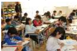
真剣に授業に取り組んでいました