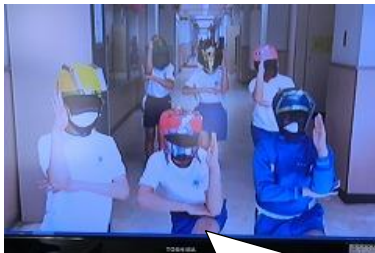
5年生が演じる北六レンジャーです 「北六小をいい学校にするぞ!!」

4月24日(水) 3校時に「たけのこ児童会」の主催で, 1年生を迎える会を行いました。2年生から6年生は, 1年生へのメッセージをそれぞれ動画に収め, 校内放送で伝えました。新しいメンバーを迎えていますますます楽しく充実した児童会にしていきます。