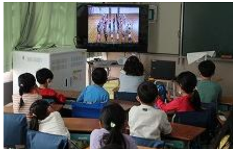
1年生は放送に真剣に見入っています。