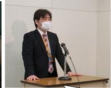
どの学年もすばらしい発表でした!