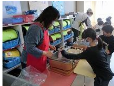
赤いエプロンを着て, 子供たちの様々な活動を見守っていただいています。