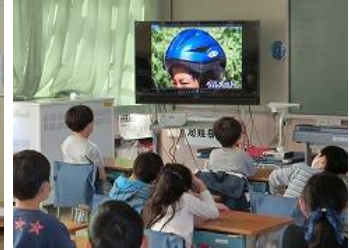
2~6年生…自転車の乗り方を学びました。