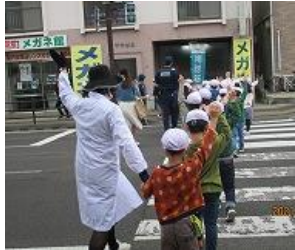
1年生…皆で実際の通学路を歩きました。

4月14日(水), 1年生の交通安全教室を行いました。当日は宮町交番から2名, 交通指導隊から6名の皆様が指導に当たってくださいました。子供たちは, 横断歩道で左右を見て手を挙げて渡るなど, 約束をしっかりと守って歩くことができました。また, 4月20日(火)には北警察署交通課の方が来校し, 2年生から6年生に向けて自転車の乗り方をご指導くださいました。転倒をしたときには頭を守ることが大切であることから, 「ヘルメットをぜひかぶってほしい」と子供たちにお話をしてくださいました。今回学んだことを普段から生かし, 交通ルールを守って安全に生活してほしいと思っています。