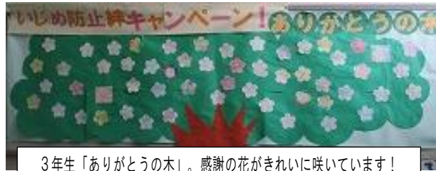
3年生「ありがとうの木」。感謝の花がきれいに咲いています！