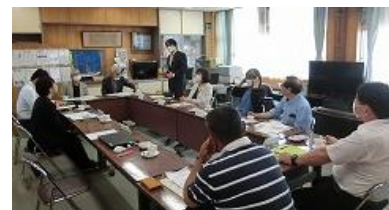
評議員・関係者評価委員の皆様と情報交換

6月25日（金）に、学校評議員会・学校関係者評価委員会を行いました。授業の様子を御覧いただき、子供たちが落ち着いて学習に取り組んでいること、教員の一生懸命な姿勢が子供たちの学びに生かされていることなど、うれしい言葉をたくさんいただきました。子供たちの健やかな成長に向けて、学校・家庭・地域がさらに連携して教育活動を支えていくことを方向性として再確認いたしました。次回の委員会は1月28日（金）に実施する予定です。