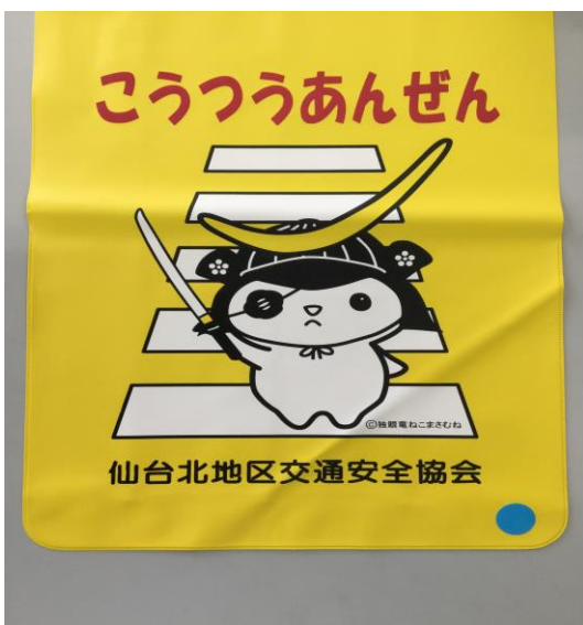
↑ 児童館に行かない子供（1枚）