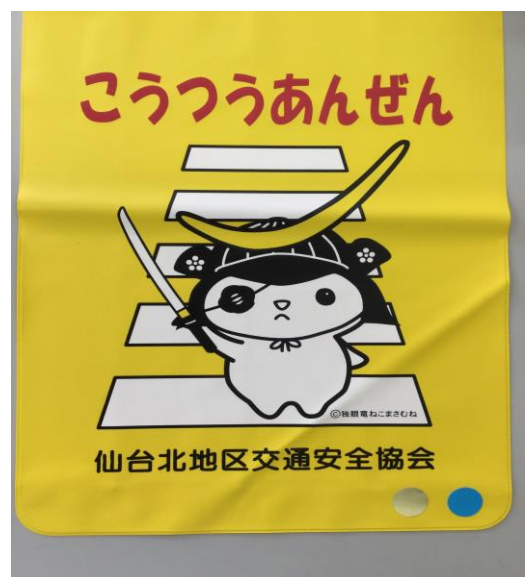
↑ 児童館に行く子供（2枚）