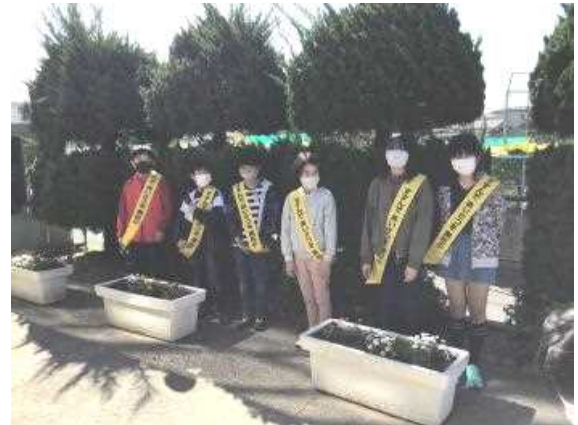
生活委員会の挨拶運動の様子