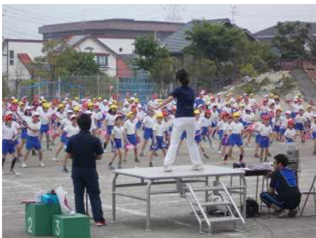
5月23日(全体練習)「すすめ踊り」の練習

雨が続いたと思ったら、急に夏のような暑さになりました。27日土曜日に迫った運動会(学区民運動会)の練習では、子供たちが大粒の汗をかくて一生懸命取り組んでいます。また、23日に行われた全体練習では、初めて参加する1年生もお兄さんやお姉さんを真似て、立派に整列したり体操をしたりして頑張っていました。恒例の「すすめ踊り」(全員参加)の準備もできあがりました。