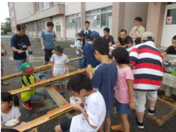
学校に泊まろう! (8月5, 6日) おやじの会主催 キャンプ(流しそうめん)

前半は暑かったのですが、後半は曇りの日が多かった夏休みとなり、元気な子供たちの声が戻ってきました。各学級では、おやじの会のキャンプや夏祭り、子供会行事など思い出話でにぎわっていました。