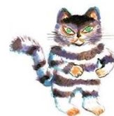
(写真上) 6年生 音楽 「愛」