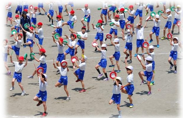
3, 4年生 エイサーの練習風景

運動会の午後の部では、地域の方に児童管理など大変お世話になります。この機会に、地域の大人の方と挨拶だけでなく、深いかかわり合いができたらしめどもうれしく思います。今後とも温かいご支援とご協力をお願いいたします。