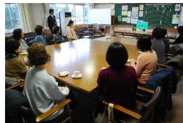
3年生によるペープサート

今年度一年間、子供たちのために読み聞かせをしてくださったどんぐりの会の皆様ですが、2月20日で今年度の活動が最後となりました。終了後は校長室で1年間を振り返りながらいろいろなお話を聞かせてくださいました。3年生児童によるペープサートや、わかくさ児童による手遊びも披露し、喜んでいただくことができました。どんぐりの会の皆様、1年間本当にありがとうございました。