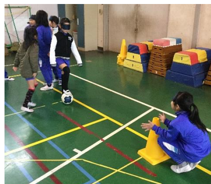
4年生ブラインドサッカー体験 言葉で伝えることの大切さを学びました

6年生は3月1日の「6年生を送る会」、4日「同窓会入会式」、そして19日の「卒業式」と6年間の締めくくりに向けて進んでいく日々となります。5年生は、学校のリーダー役を引き継ぎ、心を込めて6年生の門出を祝おうと活動しています。1年生から4年生も、6年生と一緒に過ごせる残り少ない日々を大切に生活しています。