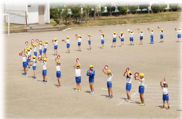
3, 4年生エイサーの練習

運動会の午後の部では、地域の方に児童管理など大変お世話になります。この機会に、地域の大人の方と挨拶だけでなく、深いかかわりができたらとてもうれしく思います。今後とも温かいご支援とご協力をお願いいたします。