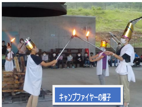
キャンプファイヤーの様子