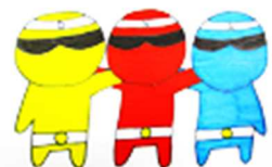
中田小いじめ防止キャラクター 「なかいんジャー」

いじめはいつでも、どの子供にも、どの学校でも起こり得るもの です。職員が一丸となっていじめの防止に努めてまいりますので、お子さんのことで気になることや心配なことがありましたら、遠慮なく御相談ください。