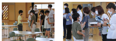
授業づくり訪問「外国語活動」