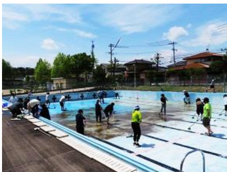
PTA プール清掃の様子

5月25日(火)、PTA プール委員会の呼びかけで20名を超える保護者の皆様にプール清掃をしていただきました。プール内部はもちろん、プールサイド、洗体槽、シャワー室やトイレも見違えるようにきれいになりました。ご協力ありがとうございました。