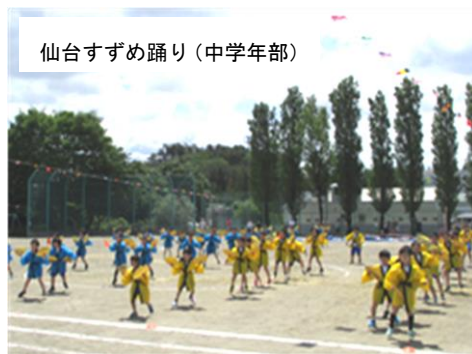
仙台すずめ踊り(中学年部)