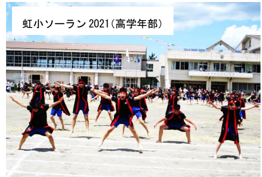
虹小ソーラン2021(高学年部)