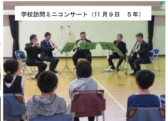
学校訪問ミニコンサート (11月9日 5年)