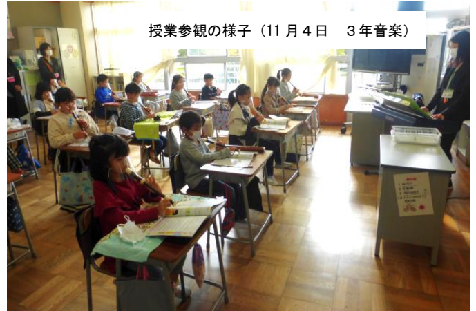
授業参観の様子 (11月4日 3年音楽)

11月9日(火)5校時に仙台フィルハーモニー管弦楽団の方をお招きして「学校訪問ミニコンサート」を開催いたしました。今年度は新型コロナウイルス感染症予防で、5年生を対象に行われていた「ふれあいコンサート」が中止になったため、「木管五重奏」の編成で市内の小学校を回って演奏会を開くことになり、本校においでいただくことになったものです。5年生の児童が楽器の紹介も含めながら美しい管楽器の音色を聞かさせていただきました。仙台フィルハーモニー管弦楽団の皆様、本当にありがとうございました。