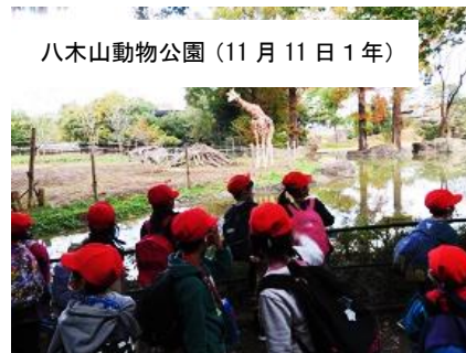
八木山動物公園 (11月11日 1年)

11月11日(木)に延期となっていた1・2年生の遠足を実施しました。1年生は八木山動物公園、2年生はうみの杜水族館に行きました。天気にも恵まれ、子供たちは動物や魚たちとの出会いに大喜びでした。