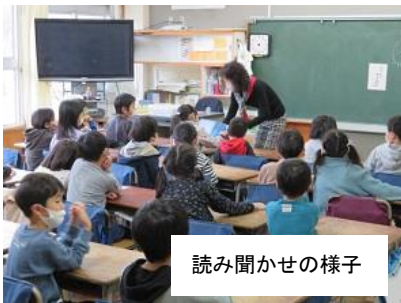
読み聞かせの様子

11月から読み聞かせボランティアの皆様の活動を再開いたしました。子供たちは月曜日の朝の読み聞かせを楽しみにしています。12日(金)には、社会学級の皆様にプランターの花植をしていただきました。きれいなパンジーが校地内と通学路を飾ってくれています。また、土曜図書開放も再開し、子供たちや地域の皆様がたくさん利用しています。子供たちのためにありがとうございます。今後ともどうぞよろしくお願いいたします。