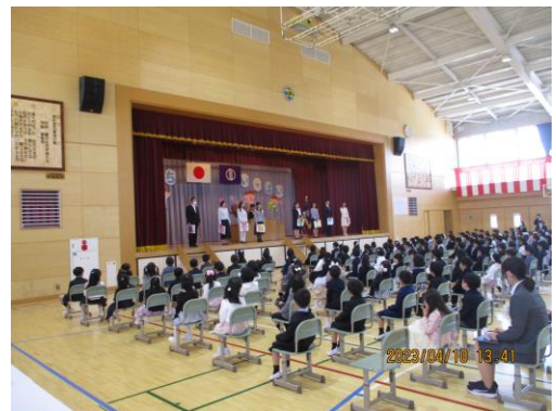
令和5年度第9回入学式の様子

さっそく次の日から、自分で教室へ行く1年生。ちょっぴり不安そうな表情を浮かべているお子さんも見られました。そのような中、6年生が昇降口や教室で温かく迎えていました。教室まで連れて行ってくれたり、教室では朝の用意を一緒に手伝ってくれたりしています。1年生もとてもうれしそうです。6年生が1年生のために行動する姿に頼もしさを感じます。さすが最高学年です。