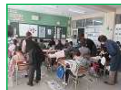
3年：ボランティアのみな さんによる毛筆指導