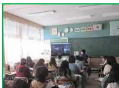
5年：トヨタ自動車工場 リモート授業