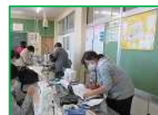
5・6年： ミシンボランティア