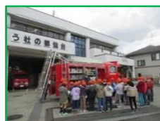
3年：校外学習 (消防署)