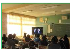
6年：心の劇場 オンライン視聴