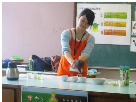
伊藤園さんは すごい！ こうされるとのみたくなるよ