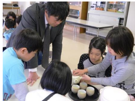
こい色が出てるね