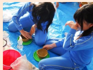
「家族とほっとタイム」