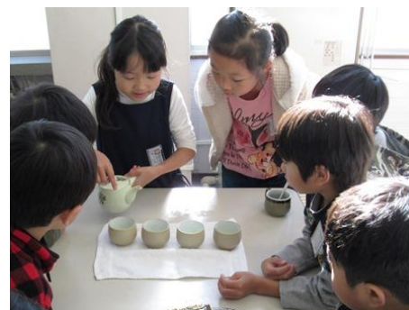
2年生「さあ めしあがれ」 1年生「おいしい」

☆ ありがとうの会をしよう ・地域のかたをもてなそう ・1年生をもてなそう ・おもてなしをしよう ・けいかくを たてよう