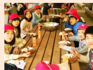
社会科 「わたしたちのくらしと食料生産」