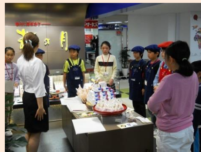
「仙台市自分づくり」 スチューデントシティ