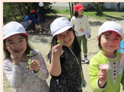
学校近くの公園で見つけた！