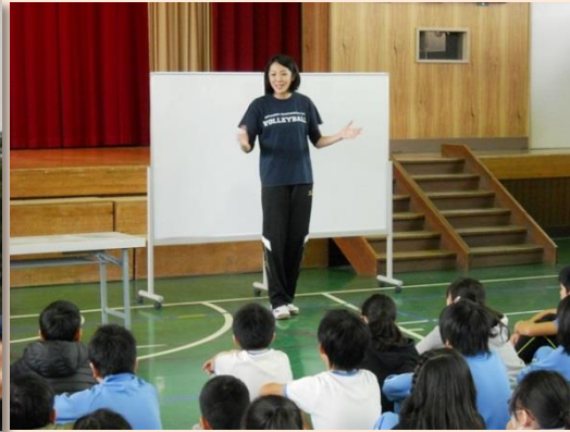
自分づくり夢教室