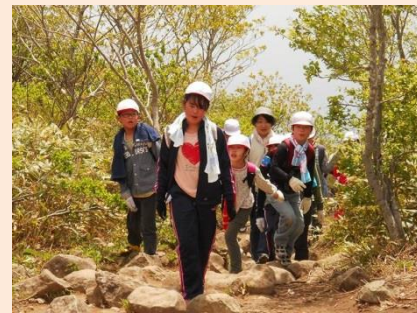
宿泊学習「野外活動」 泉岳自然散策