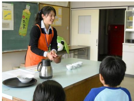
伊藤園さんに聞いてみた