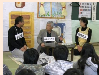
家庭科 「見つめてみよう わたしと家族の生活」