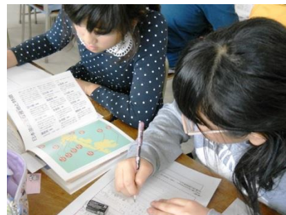
味の違いは産地にあり？