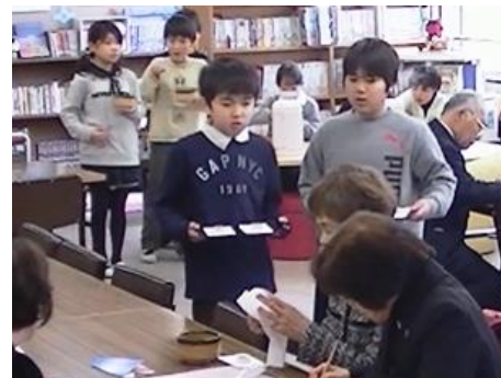
来ひんのみなさんによろこんでもらおう！