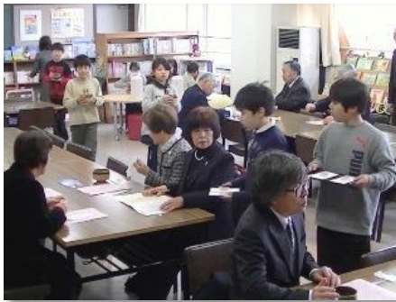
入学式へようこそ