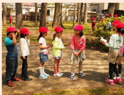
たてわり遠足でお世話しよう