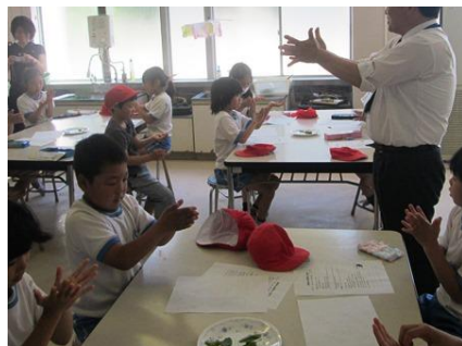
もみかた おぼえてる？