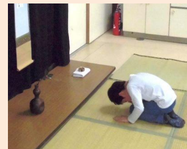
日本の美しい心を教えてもらう