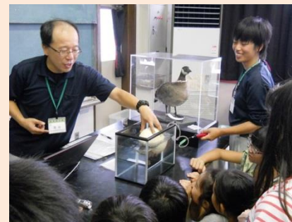
「生き物と環境」 生き物先生(八木山動物園)