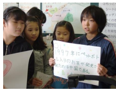
作る会社によって 売るための秘密がある！