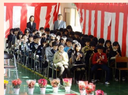
卒業式はおめでとうのおもてなし