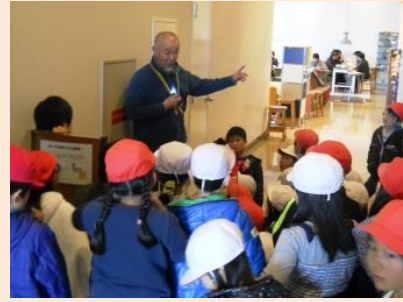
外にも先生がいっぱいいるよ

理科 「春のしぜんにとび出そう」 「たねをまこう(大豆)」 「どれぐらい育ったかな」 「みができたよ(大豆)」