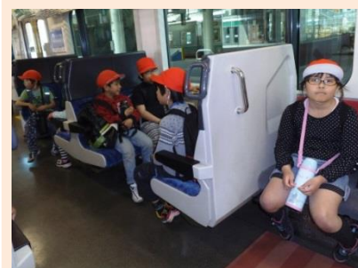
乗り物にもやさしい工夫が