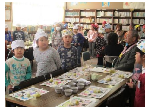
お客様「みんなじょうずだね」 「とってもおいしいよ」

☆ ありがとうの会をしよう ・地域のかたをもてなそう ・1年生をもてなそう ・おもてなしをしよう ・けいかくを たてよう