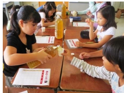
味の違いは濃さ？ 他にどんな理由が