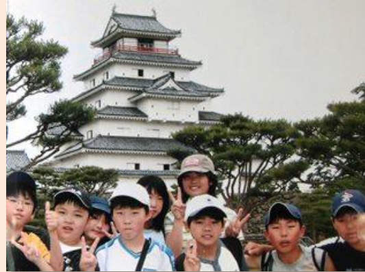
福島を応援しよう