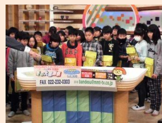
「情報を生かすわたしたち」