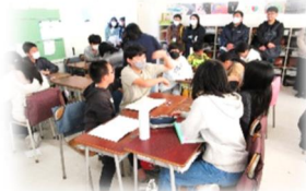
6年算数「オムニバス授業」