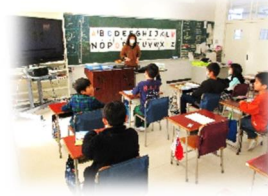
3年外国語「アルファベットとなかよし」