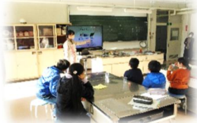
5年家庭科「食べて元気に」