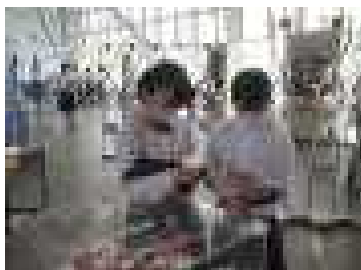
【展示学習】課題をクリアしてシールをゲット！