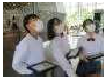
【展示学習】さまざまな展示物に興味津々。