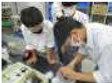
【地学コース】火成岩の鉱物を採取しました。