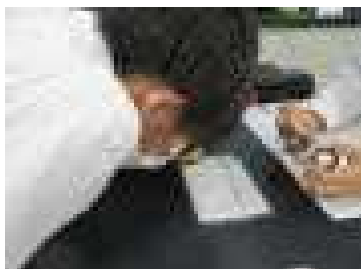
【化学コース】金属イオンについて調べました。

27日（火）に科学館学習に行ってきました。午前中は「生物」・「化学」・「地学」・「物理」の4分野に分かれて実験実習を行いました。いつもの授業よりも長い90分間の実験実習でしたが、内容の濃い学習内容と楽しい実験のおかげで、時間を忘れて熱心に取り組んでいました。午後の展示学習では、タブレットに示された課題に取り組みました。みんなで協力し、楽しみながら学習に取り組む様子が見られました。