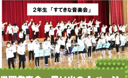
2年生「すてきな音楽会」