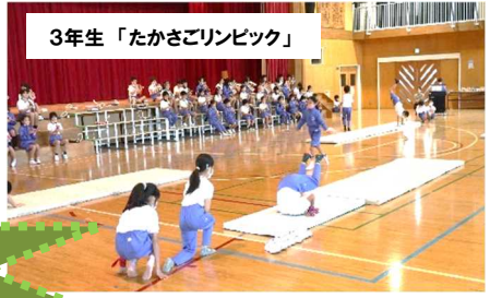
3年生「たかさごリニック」