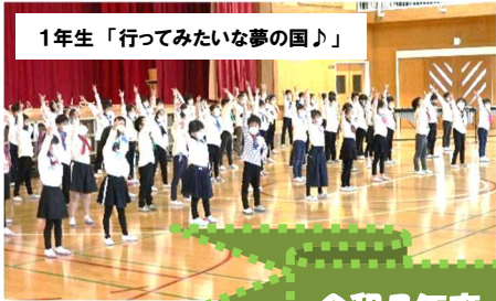
1年生「行ってみたい夢の国」

実施後には、保護者の皆様から子供たちの努力に対するお褒めの言葉等をたくさん頂戴しました。また、学習発表会の準備に当たりましては、服装の用意などの面でもご配慮をいただき、重ねて御礼申し上げます。