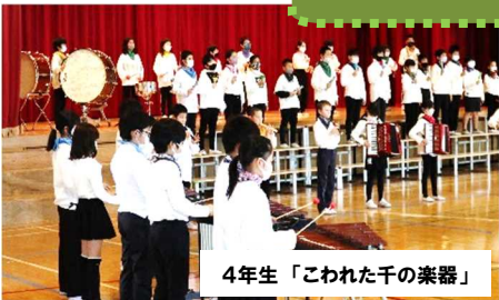
4年生「こわれた千の楽器」