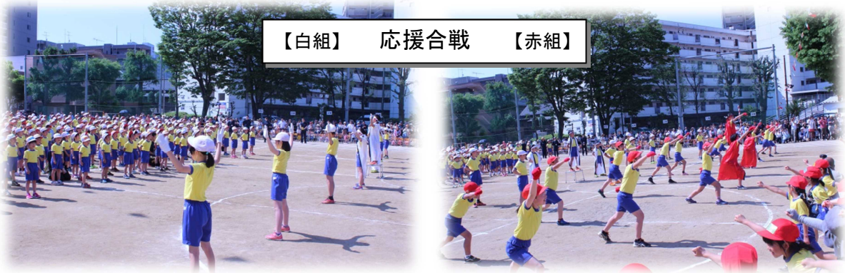
【白組】 応援合戦 【赤組】