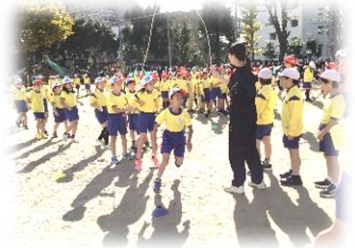
3年生 ミニ運動会 【長縄競争】