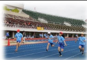
6年生 榴小オリンピック2020

1月14日(木)に、体育館で「縄跳び大会」を実施します。個人種目や団体種目で記録を競い合います。記録の向上を目指すだけでなく、実行委員をはじめ、審判や得点などの係児童も決めて、子供たちの活躍の場を多く持つ内容を考えています。