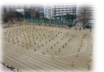
4年生 エイサー披露会