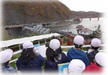
4年生 校外学習 (釜房ダム, みちのく湖畔公園)