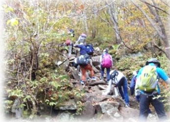
5年生 野外活動 「泉岳自然ふれあい館」