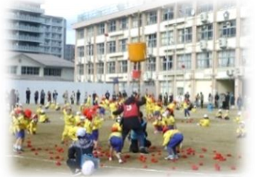
1年生 ミニ運動会 【玉入れ競争】