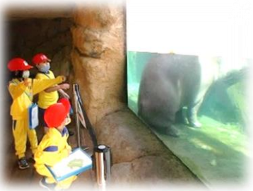
1年生 遠足「八木山動物園」