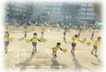
2年生 ミニ運動会 【すずめ踊り】