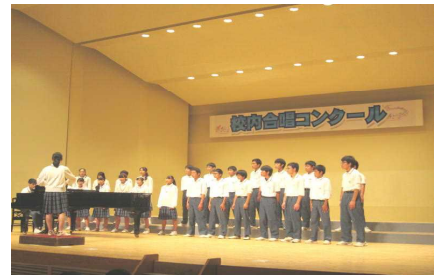
▲3組の絆「言葉にすれば」