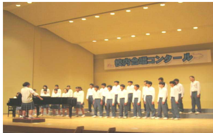
▲2組の美しい「ヒカリ」