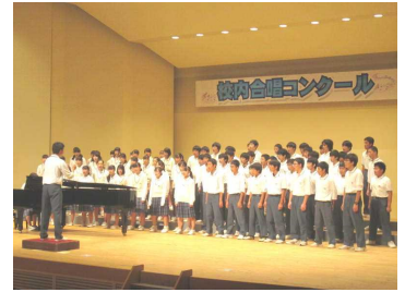
▲学年合唱「大地讃頌」

今回の関わりを通じて、生徒は、人としてまた一回り大きく成長したのではないかと思います。今後の更なる成長を期待しています。お疲れ様でした。また、保護者の皆様におかれましては御多用の中、大勢御来場いただき大変ありがとうございました。