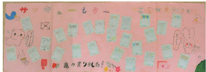
「サンキューレター」掲示物

7月は、4月からの学習のまとめをしっかりと行い、充実した気持ちで夏休みを迎えられるよう指導して参ります。御家庭でも引き続き御支援をよろしくお願い申し上げます。