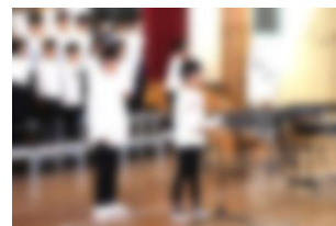
6年「おわりのことば」