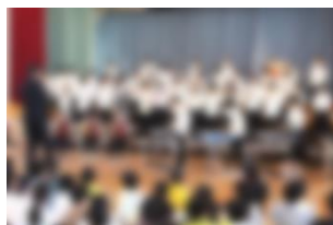
6年「HEROES～音楽に思い込めて～」