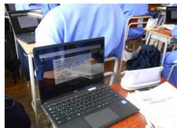
生徒の机上一人一台のタブレット端末

理科の授業の場合、模範実験の場面等で教師の手元の様子を撮影することにより、一人一人がタブレット端末で確認することが可能となります。他教科の授業でも同様の工夫を行っています。