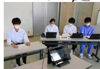
教室の様子↓各自がタブレットで承認

今回の松友会総会も、中学生一人一人が成長するための大きな手立てであり、意義のある総会となりました。中学生の多方面での活躍が大いに期待される総会となりました。