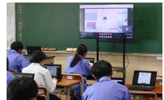
クラスでのフリートークの一場面