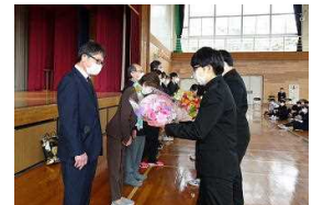
写真は昨年度の離任式の様子です