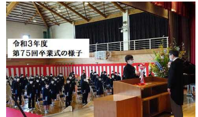
(写真は昨年度の卒業式の様子です)